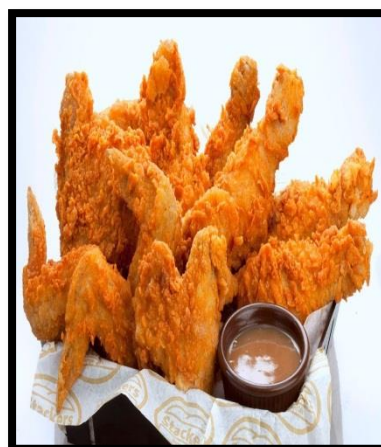
изделия из курицы.